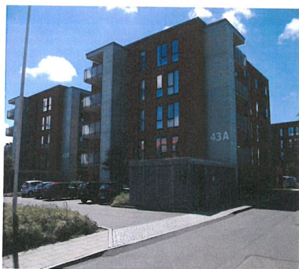
Emil Møllers Gade